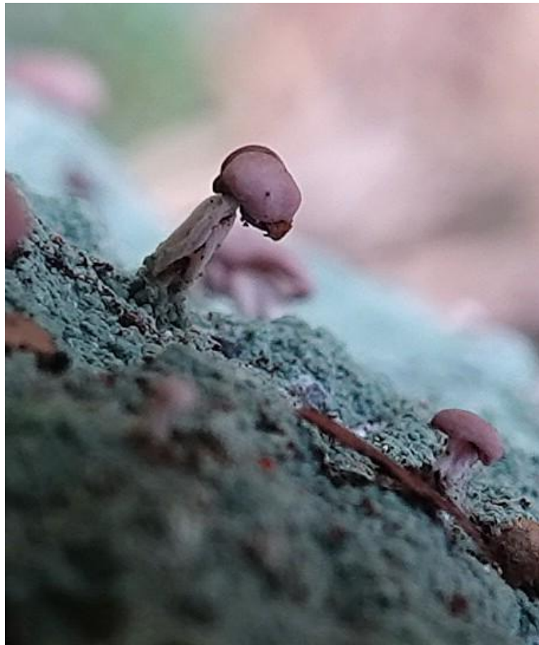
Baeomyces rufus (Huds.) Rebent., 1804 - Baeomycetales - Baeomycetaceae