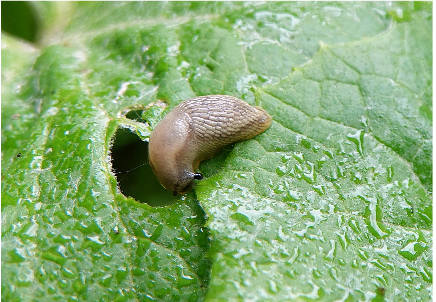
Arion sp. - Stylommatophora - Arionidae