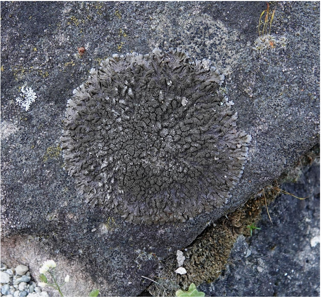
Xanthoparmelia verruculifera (Nyl.) O. Blanco, A. Crespo, Elix, D. Hawksw. & Lumbsch Lecanorales - Parmeliaceae

Nouveauté pour l'Inventaire des Lichens de l'Ecomusée