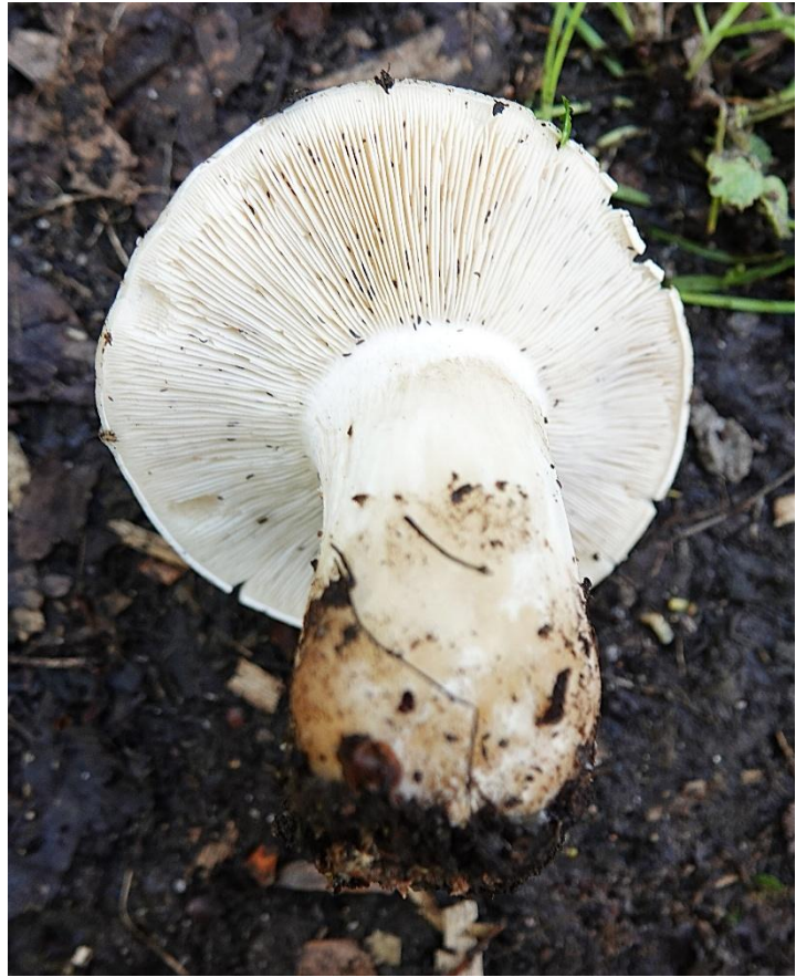
Calocybe gambosa (Fr.) Donk, 1962 Tricholome de la St-Georges - Calocybe à pied robuste - Mousseron Mousseron vrai - Mousseron de printemps Tricholomatales - Lyophyllaceae

(Lieu : à l'arrière du Grand marais- zone vers F-8)