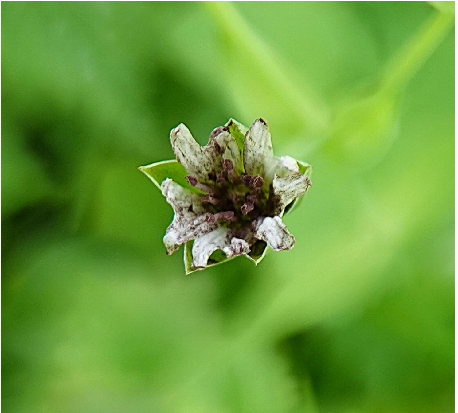
Microbotryum stellariae (Sowerby) G. Deml & Oberw., 1982 Microbotryales - Microbotryaceae