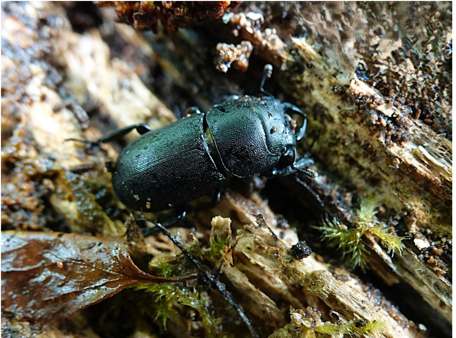
Dorcus parallelipedus (Linnaeus, 1758) Petite biche - Petite lucane - Dorcus - Coleoptera - Lucanidae

(Lieu : vieux tas de bois - zone vers I-5)