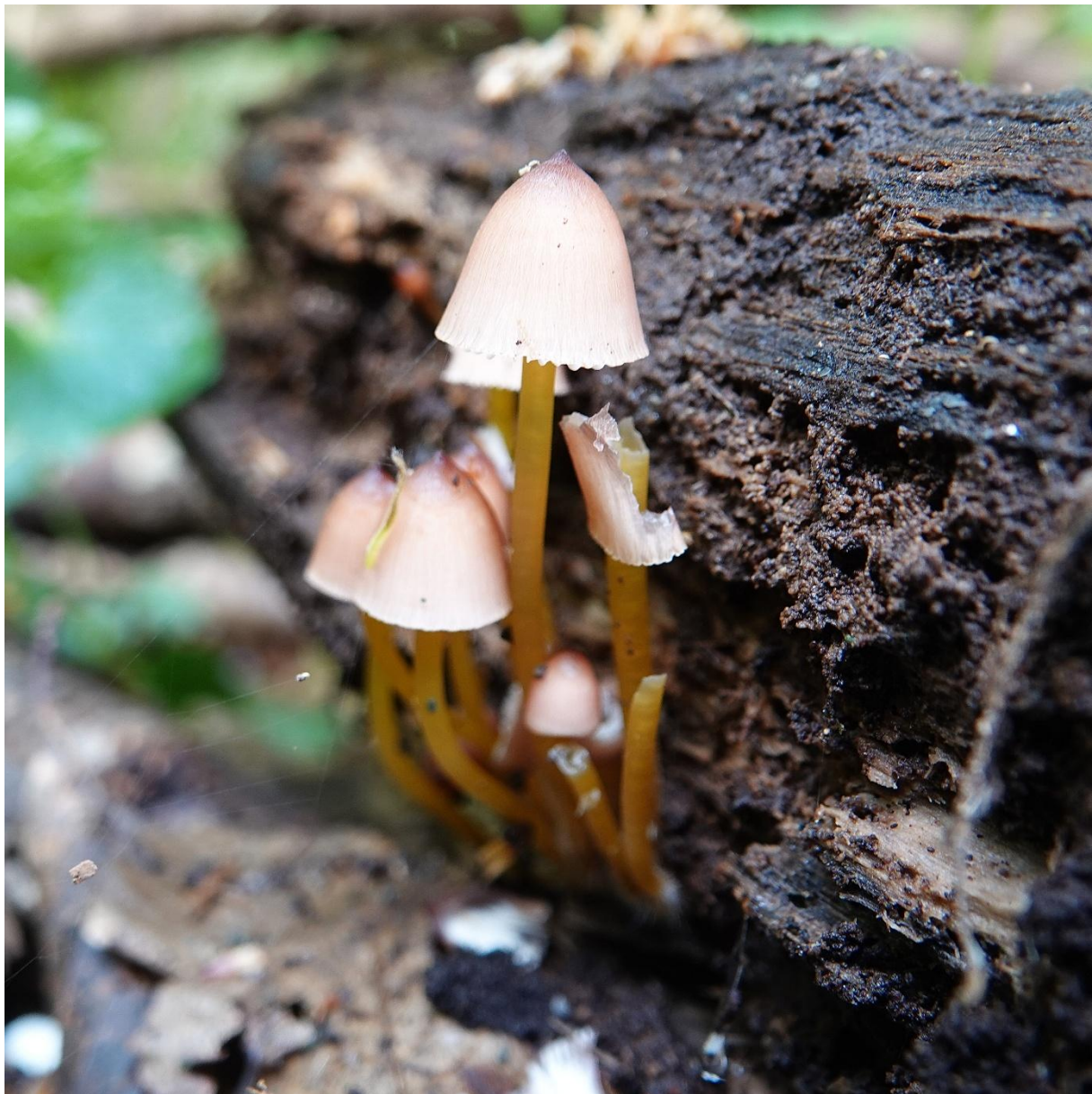
Mycena renatii Quél., 1886 Mycène à pied jaune - Tricholomatales - Mycenaceae

(sur le vieux tas de bois - zone vers I-5)