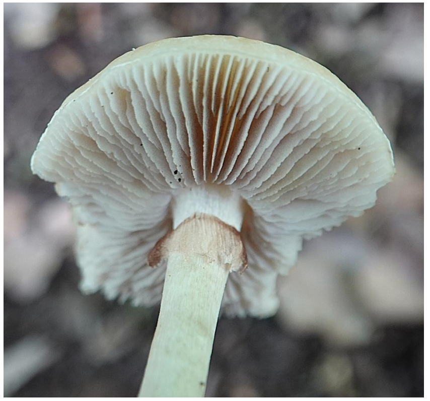
Agrocybe praecox (Pers.) Fayod, 1889 Pholiote précoce - Agrocybe précoce - Agaricales - Bolbitiaceae

(Lieu : arrière Grand marais - zone vers H-7)