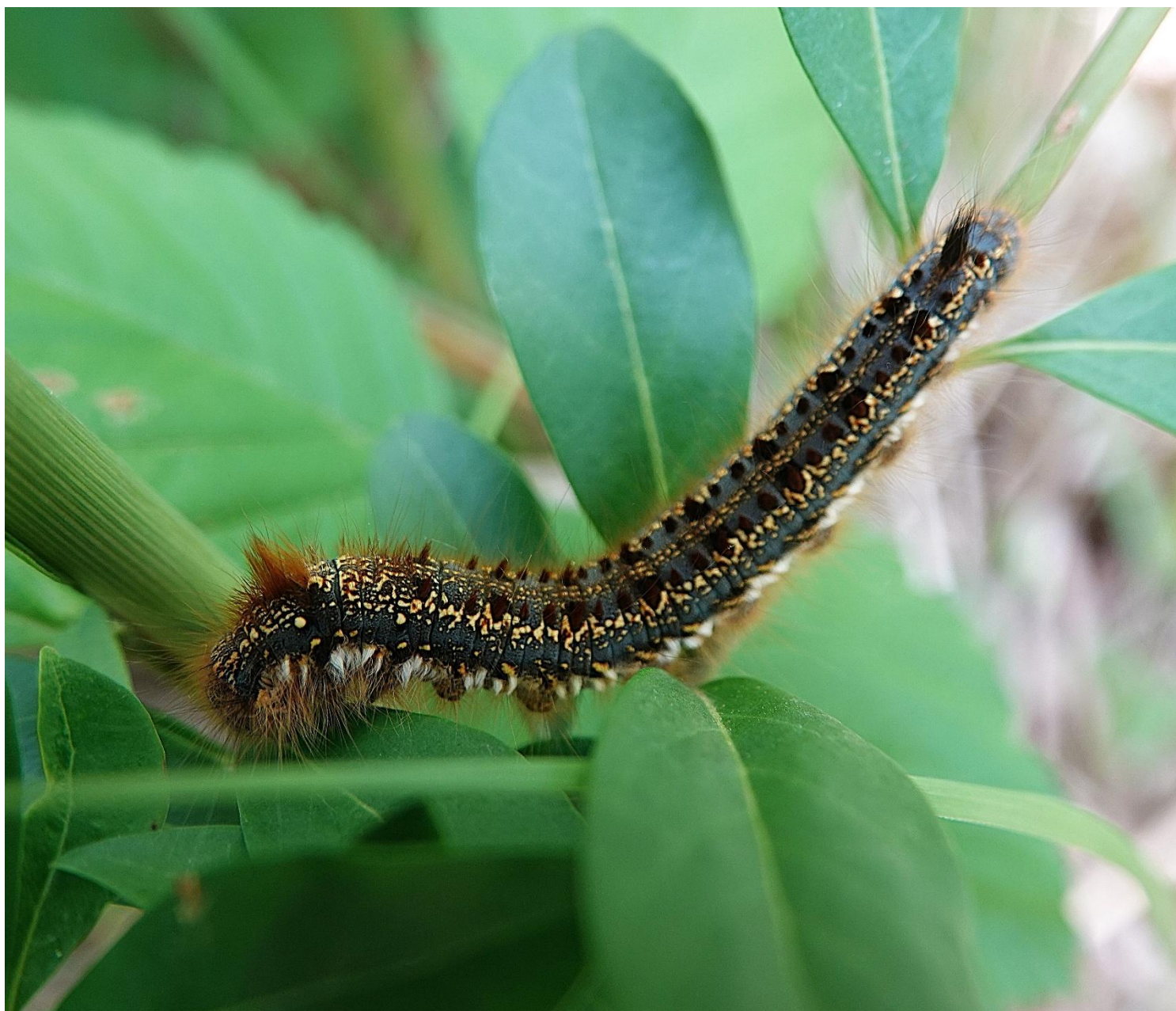
Euthrix potatoria (Linnaeus, 1758) « chenille » La buveuse - Lepidoptera - Lasiocampidae