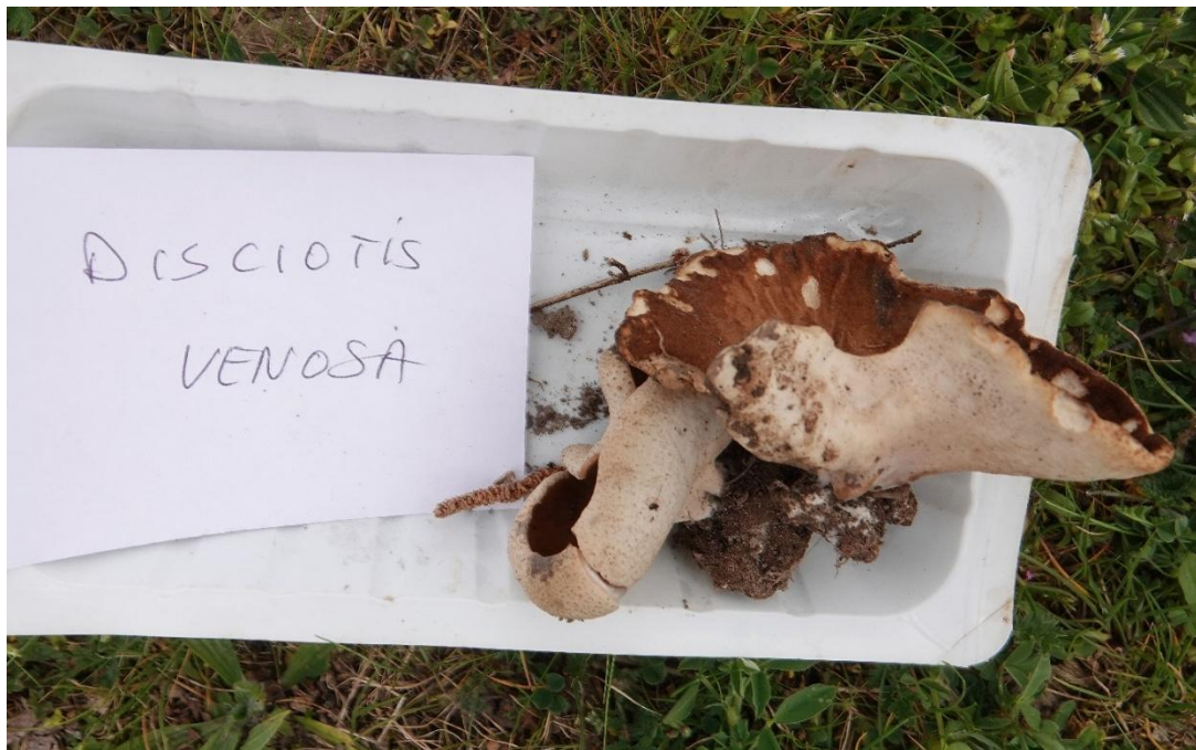
Disciotis venosa (Pers.) Arnould, 1893 Pézize veinée - Pezizales - Morchellaceae