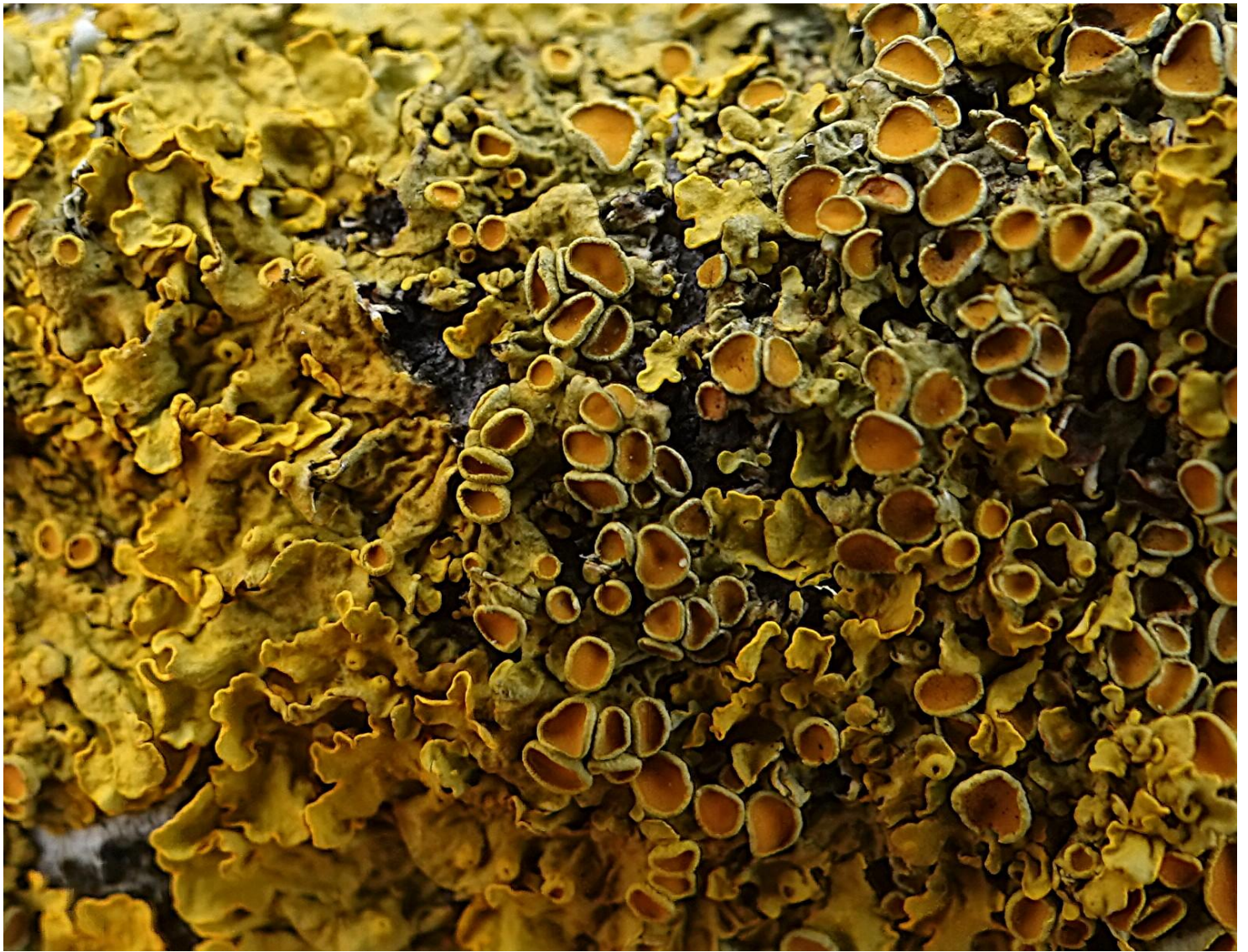
Xanthoria parietina (L.) Th. Fr., 1860 Lichen encroûtant jaune - Parmélie des murailles Teloschistales - Teloschistaceae