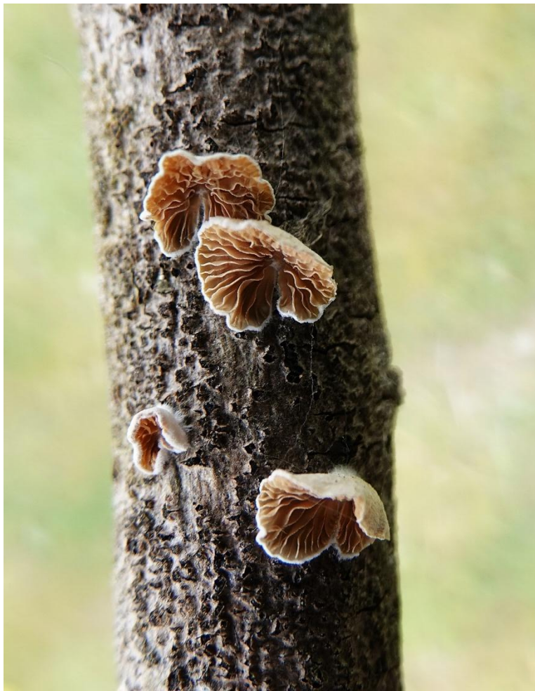
Crepidotus cesatii (Rabenh.) Sacc., 1877 Crépidote à spores sphériques - Agaricales - Crepidotaceae