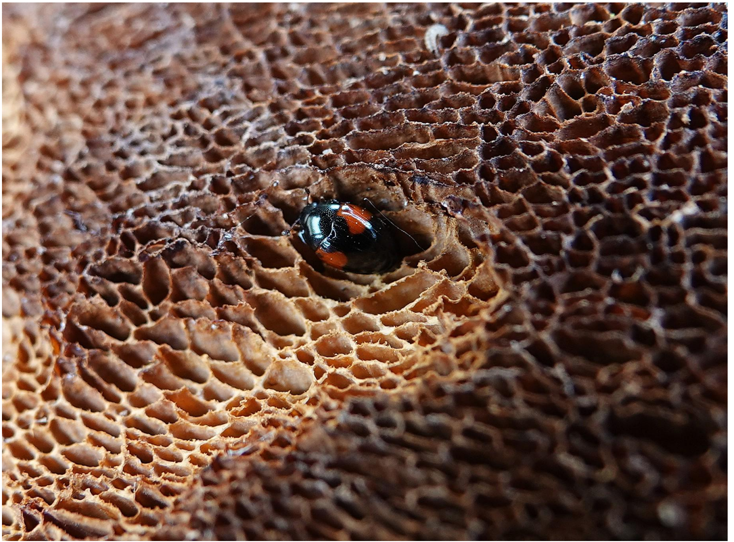
Tritoma bipustulata Fabricius, 1775 - Coleoptera - Erotylidae