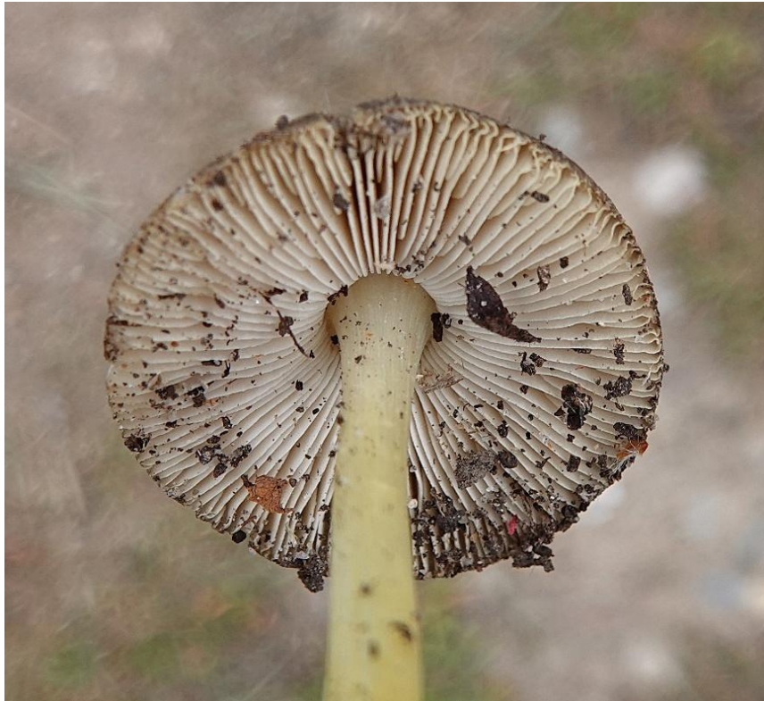
Pluteus romellii (Britzelm.) Sacc., 1895 Plutée de Romell - Pluteales - Pluteaceae