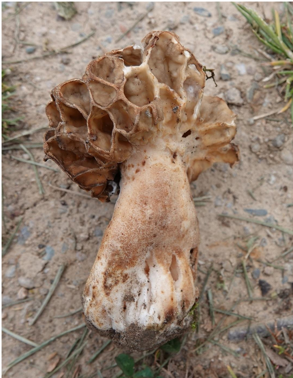
Morchella esculenta (L.) Pers., 1794 Morille ronde - Morille grise - Pezizales - Morchellaceae