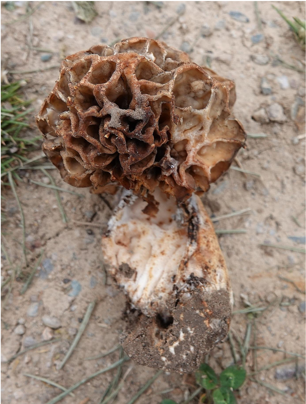
Morchella esculenta (L.) Pers., 1794 Morille ronde - Morille grise - Pezizales - Morchellaceae