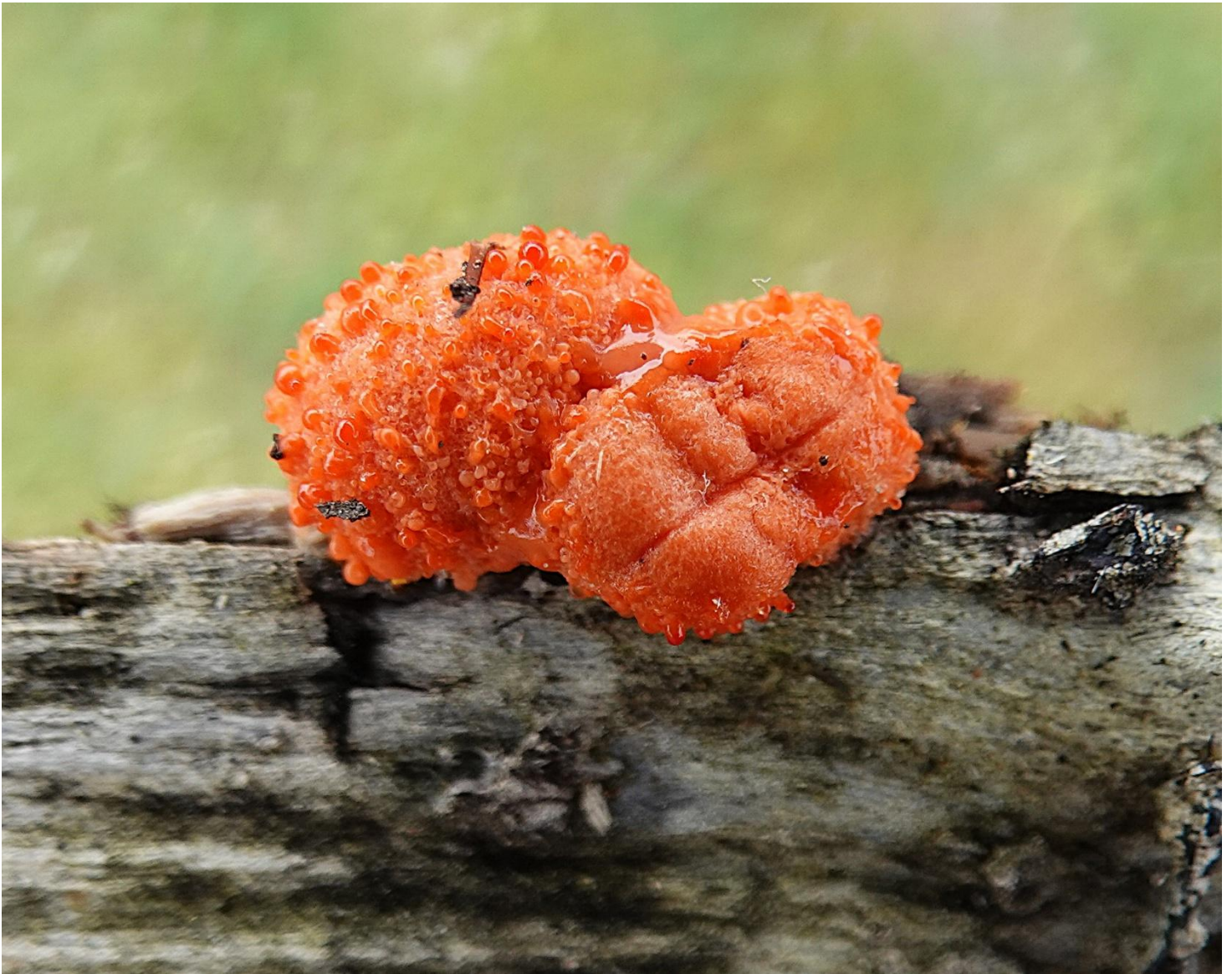
Tubifera ferruginosa (Batsch) J.F. Gmel., 1791 Tubifère rouillé - Tubifère ferrugineux - Liceales - Reticulariaceae