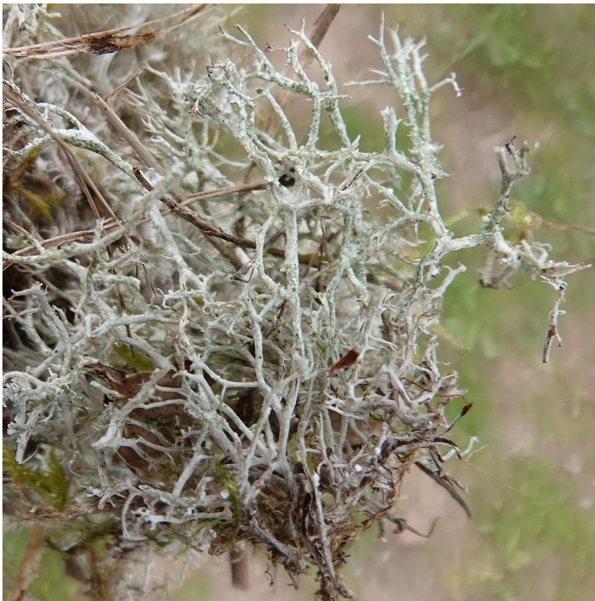
Cladonia rangiformis Hoffm., 1796 - Lecanorales - Cladoniaceae