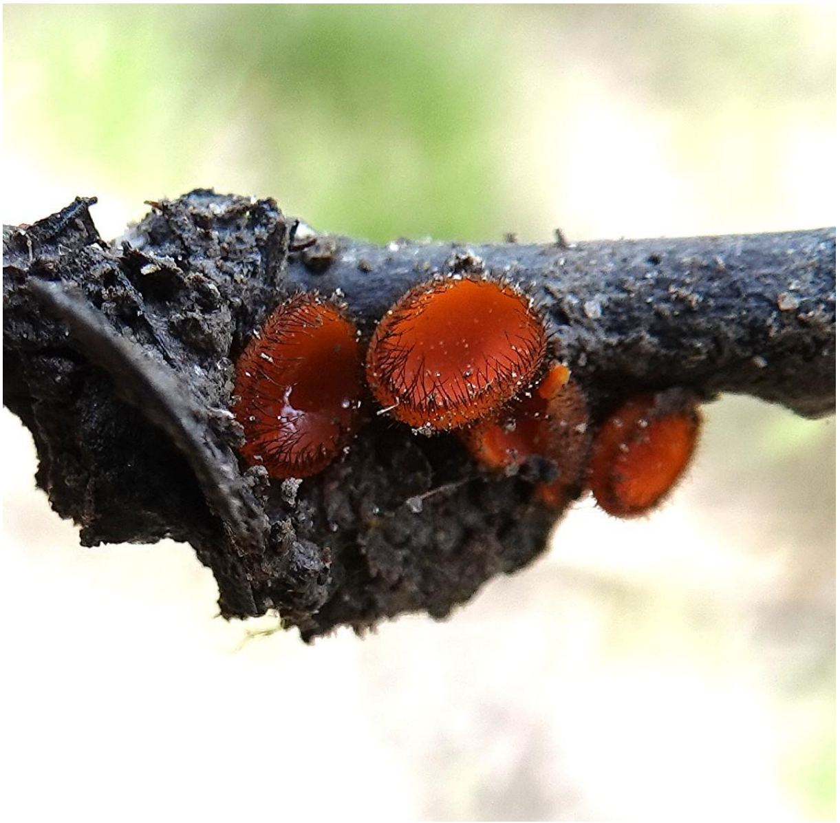
Scutellinia sp. - Pézize - Pezizales - Pyronemataceae