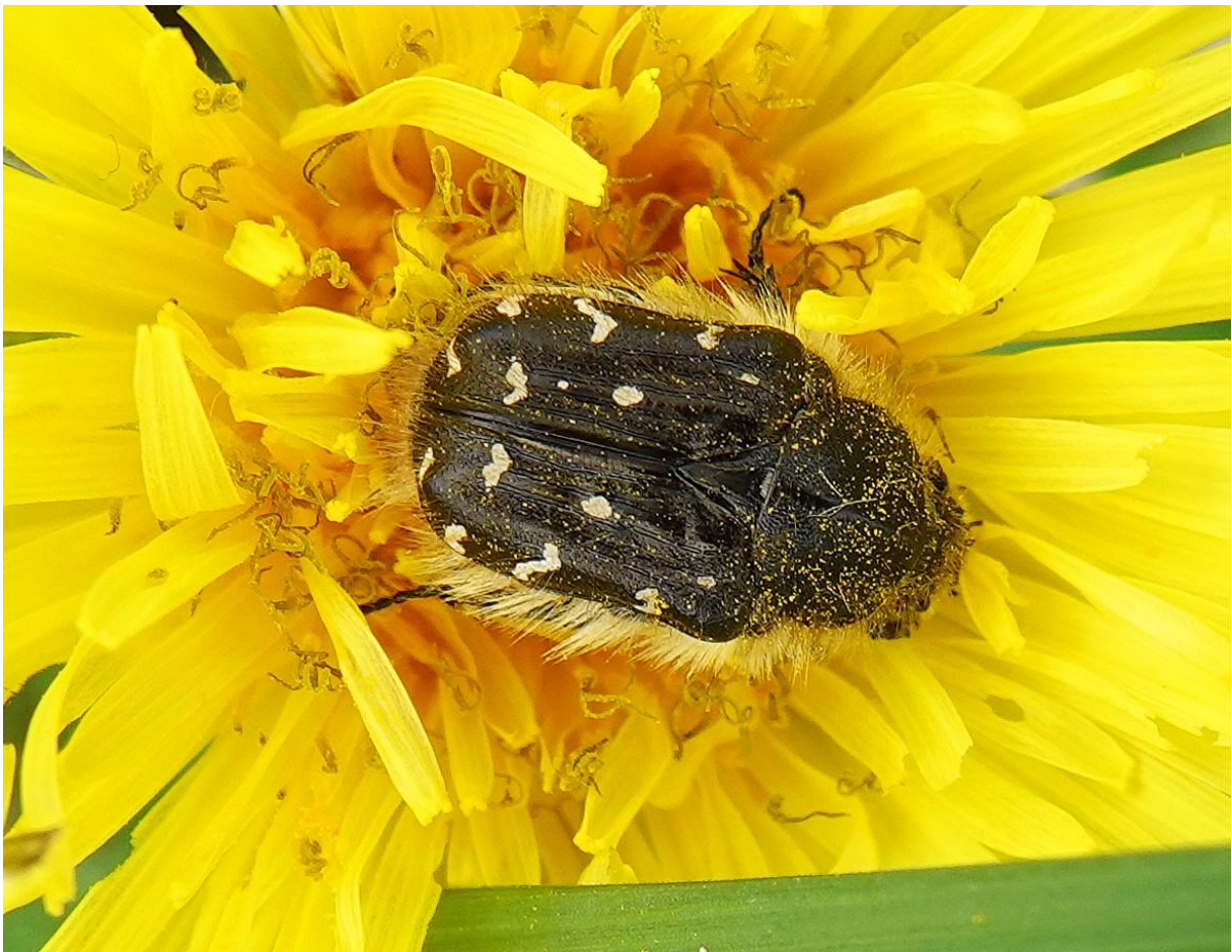
Tropinota hirta (Poda, 1761) Cétoine hérissée - Cétoine velue - Coleoptera - Scarabaeidae