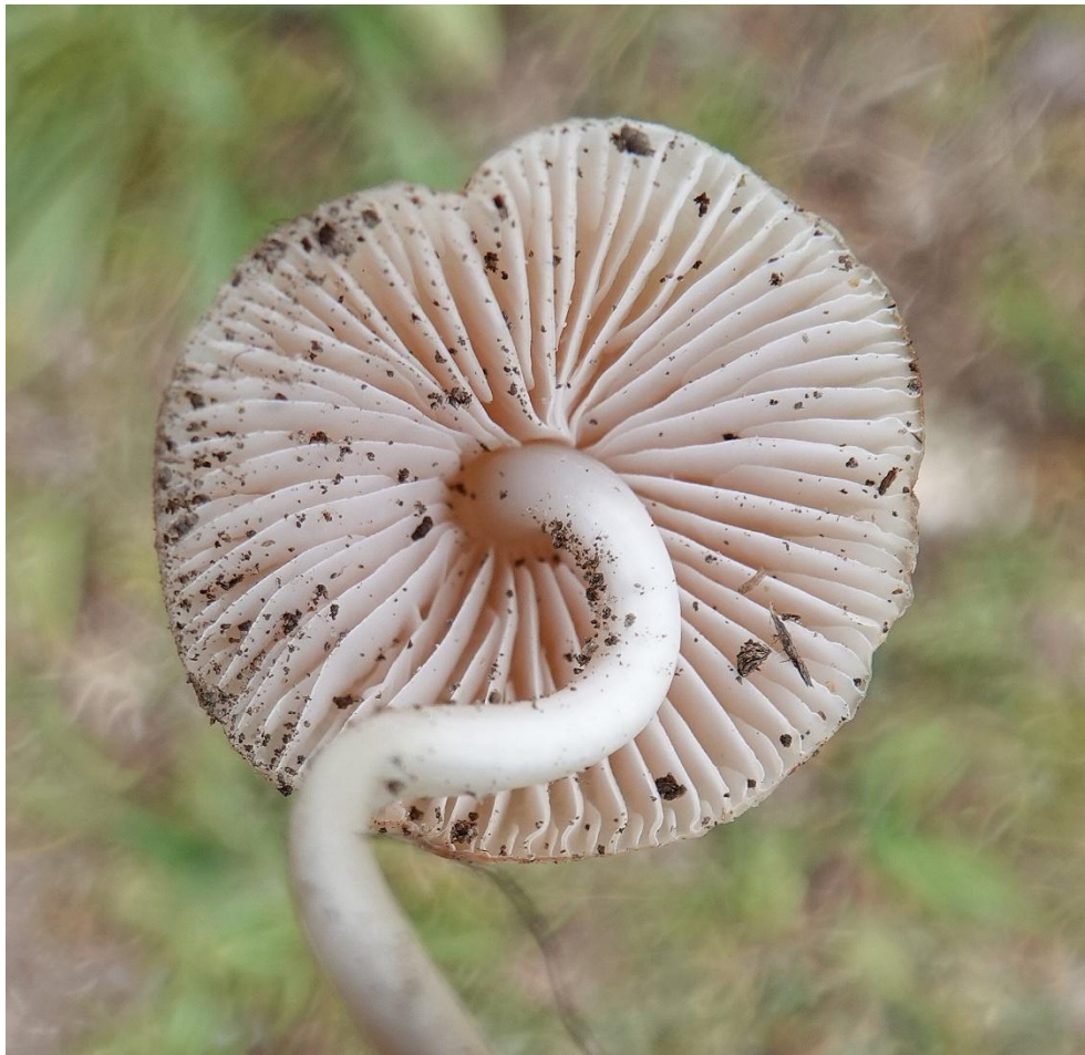
Mycena galericulata (Scop.) Gray, 1821 Mycène casquée - Mycène en casque - Tricholomatales - Mycenaceae