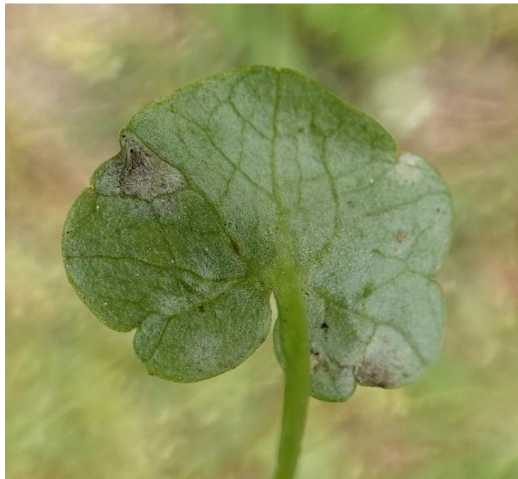
Entyloma ficariae A.A. Fisch. Waldh., 1877 Entylomatales - Entylomataceae