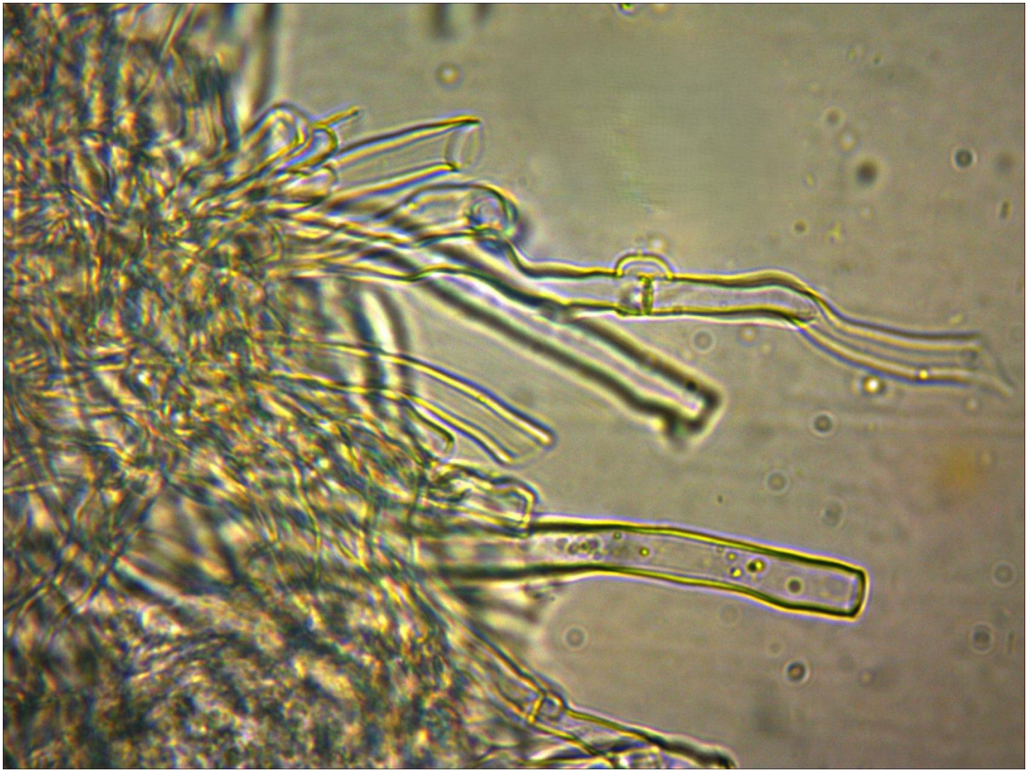
Vue au microscope n° 3 de Bjerkandera fumosa (Pers.) P. Karst., 1879

Boucles abondantes dans les hyphes. (Huile d'immersion, 1000x).