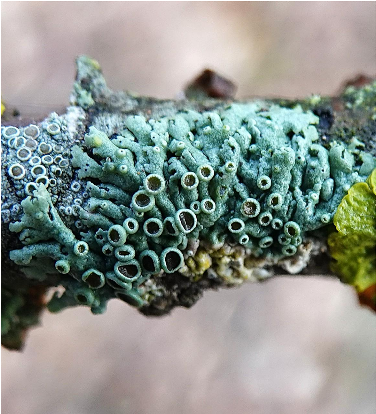
Physcia stellaris (L.) Nyl., 1853 - Caliciales - Physciaceae (morpho thalle maculé)