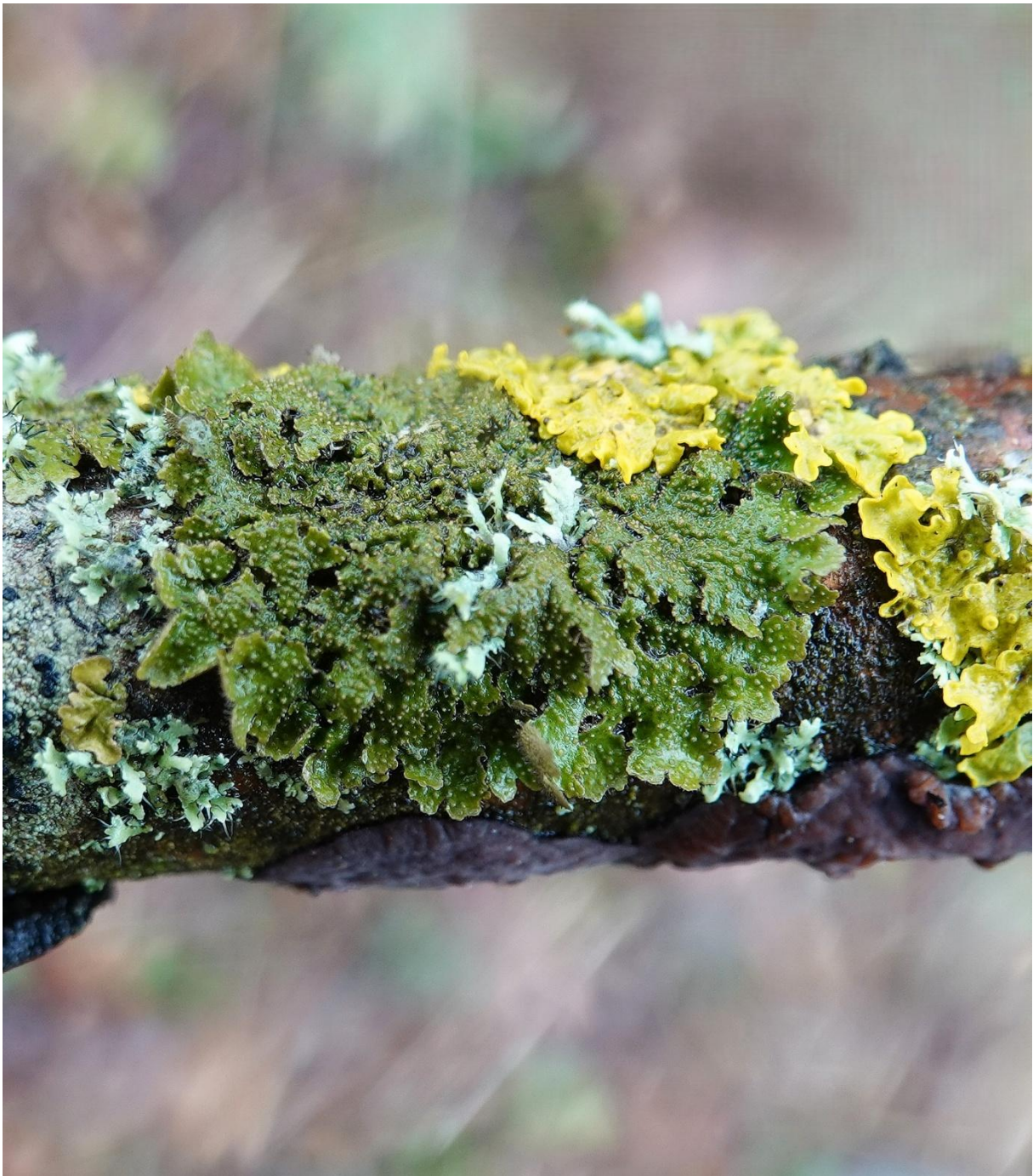
Melanohalea exasperata (De Not.) O. Blanco, A. Crespo, Divakar, Essl., D. Hawksw. & Lumbsch, 2004 Lecanorales - Parmeliaceae