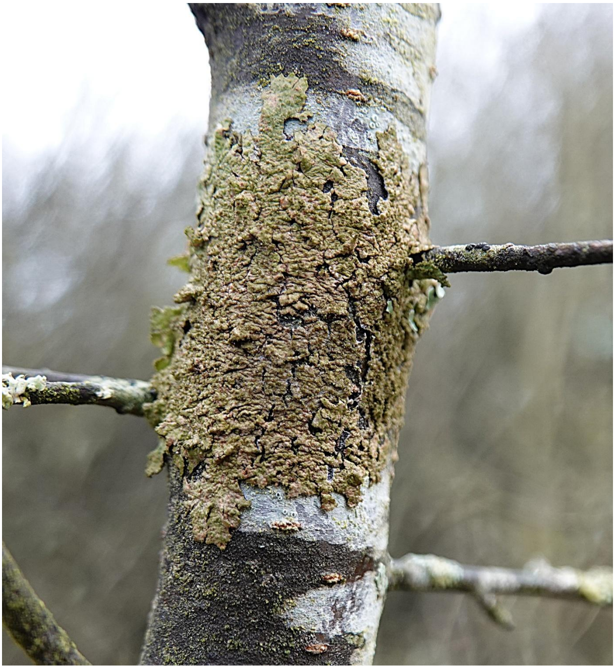
Melanelixia subaurifera (Nyl.) O. Blanco, A. Crespo, Divakar, Essl., D. Hawksw. & Lumbsch, 2004 Lecanorales - Parmeliaceae