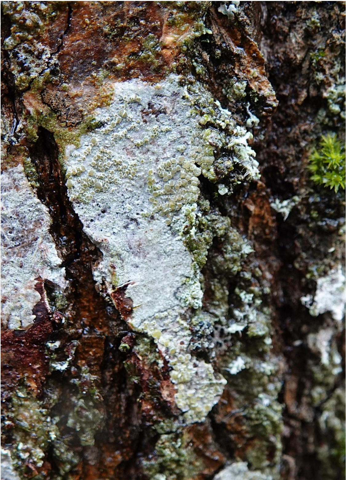
Lecanora intumescens (Rebent.) Rabenh., 1845 Lecanorales - Lecanoraceae

Nouveauté pour l'Inventaire des Lichens de l'Écomusée