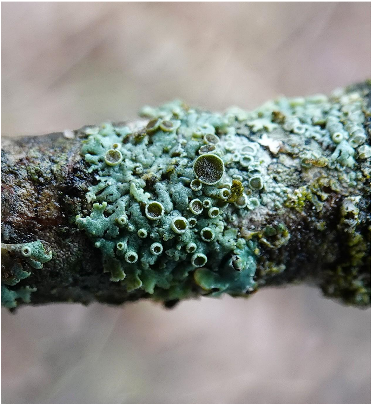
Physcia stellaris (L.) Nyl., 1853 - Caliciales - Physciaceae (morpho thalle maculé)