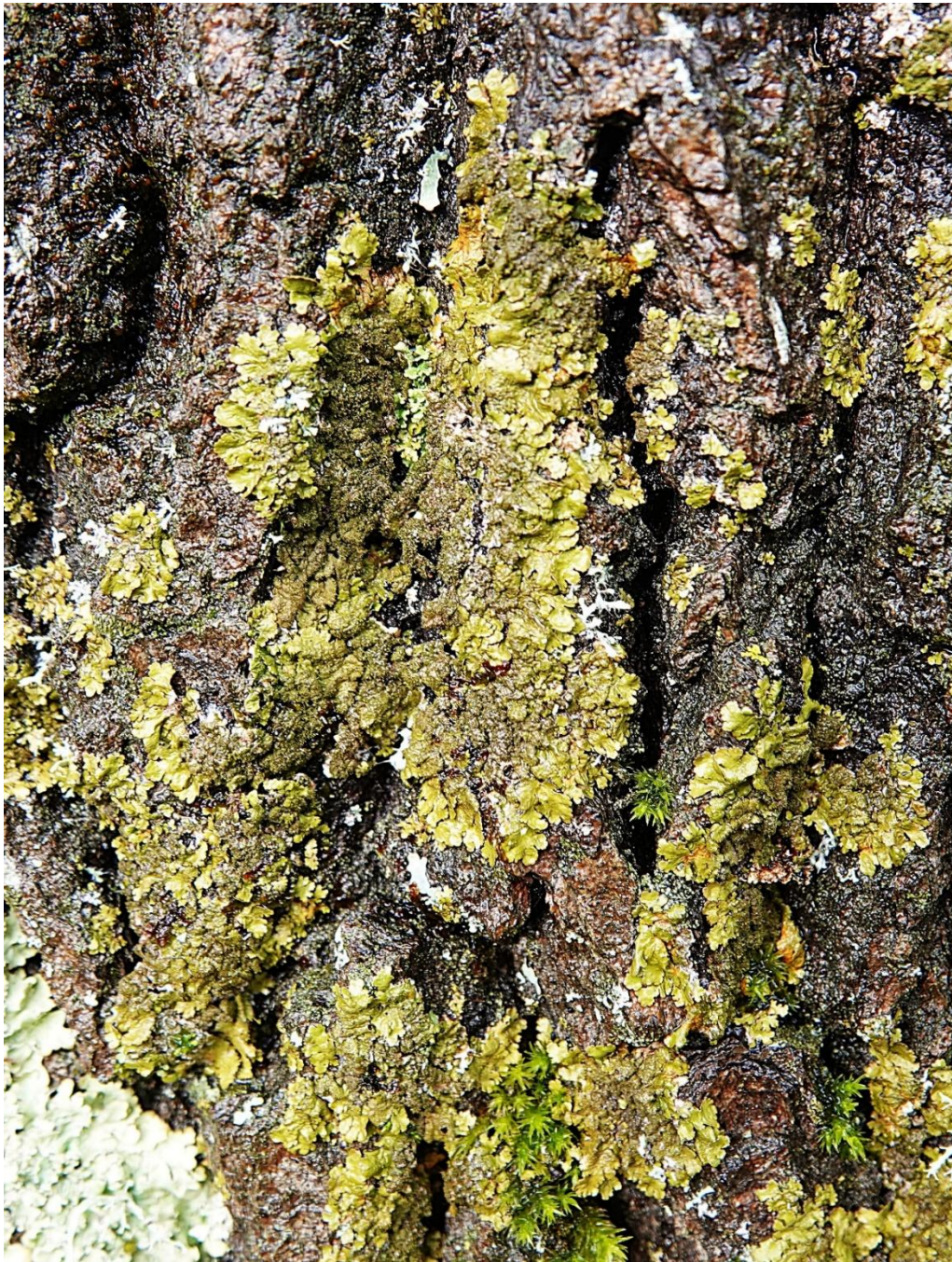
Melanelixia subaurifera (Nyl.) O. Blanco, A. Crespo, Divakar, Essl., D. Hawksw. & Lumbsch, 2004 Lecanorales - Parmeliaceae