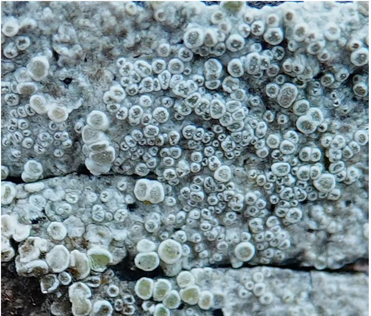
Lecanora carpinea (L.) Vain, 1888 Glaucomaria carpinea (L.) S.Y. Kondr., Lökös & Farkas, 2019 (INPN) Lecanorales - Lecanoraceae

« Lichen crustacé ‘apothécies brunes’ sur clôture »