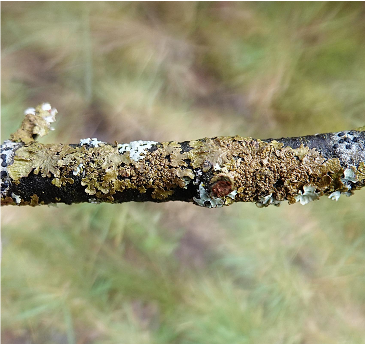
Melanelixia subaurifera (Nyl.) O. Blanco, A. Crespo, Divakar, Essl., D. Hawksw. & Lumbsch, 2004 Lecanorales - Parmeliaceae