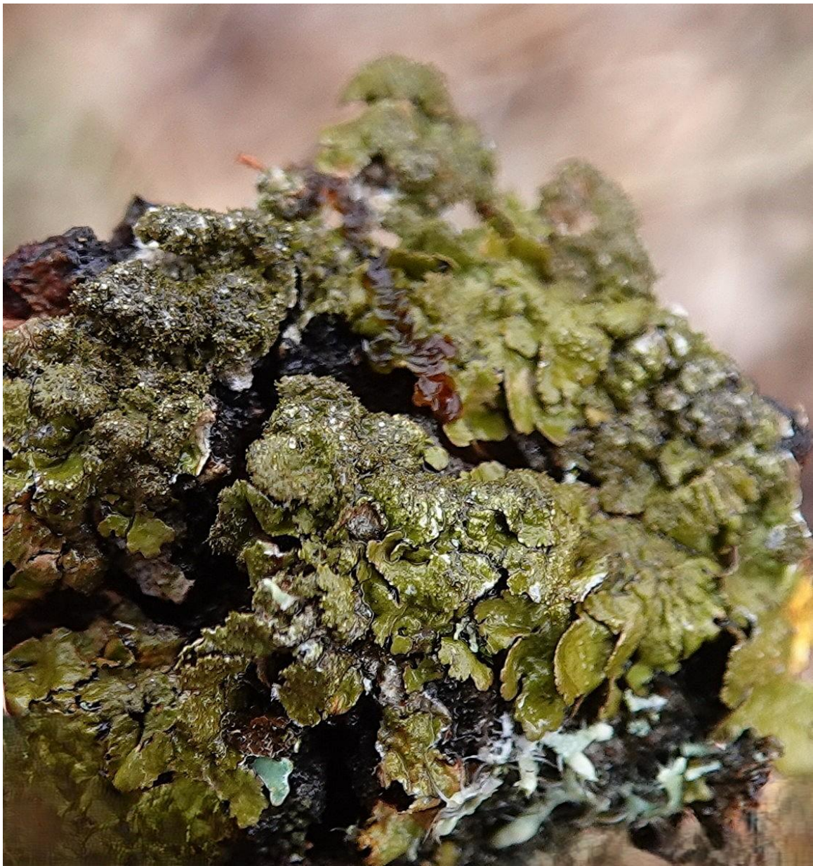
Melanelixia subaurifera (Nyl.) O. Blanco, A. Crespo, Divakar, Essl., D. Hawksw. & Lumbsch, 2004 Lecanorales - Parmeliaceae