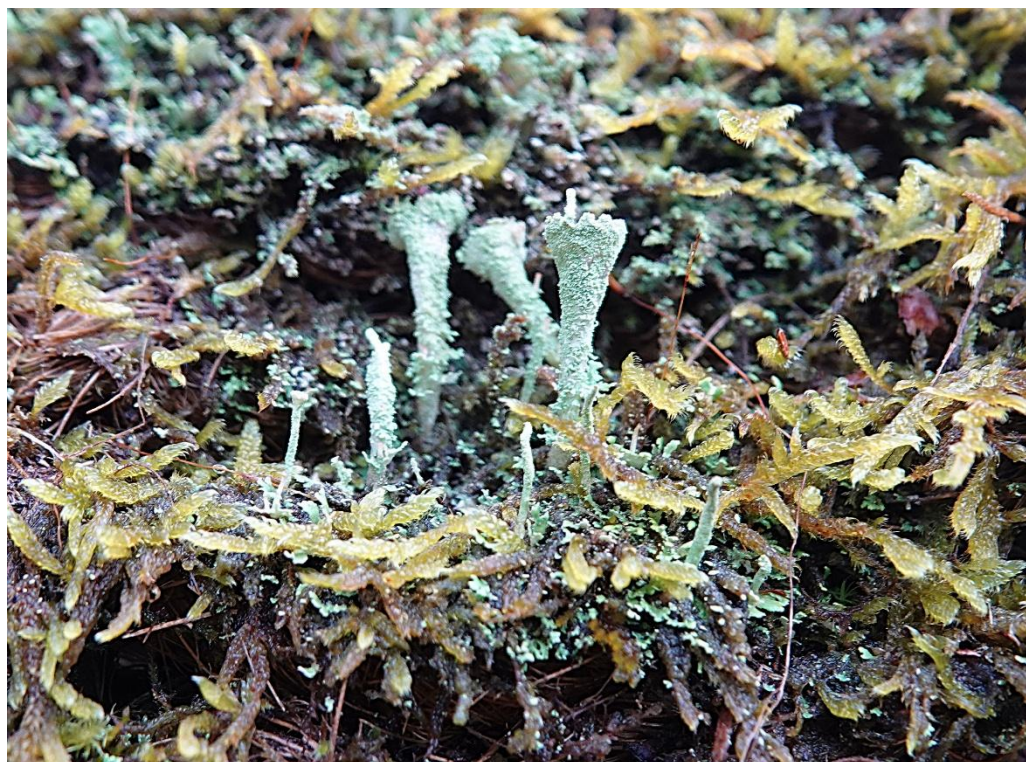
Cladonia ramulosa (With.) J.R. Laundon, 1984 Lecanorales - Cladoniaceae