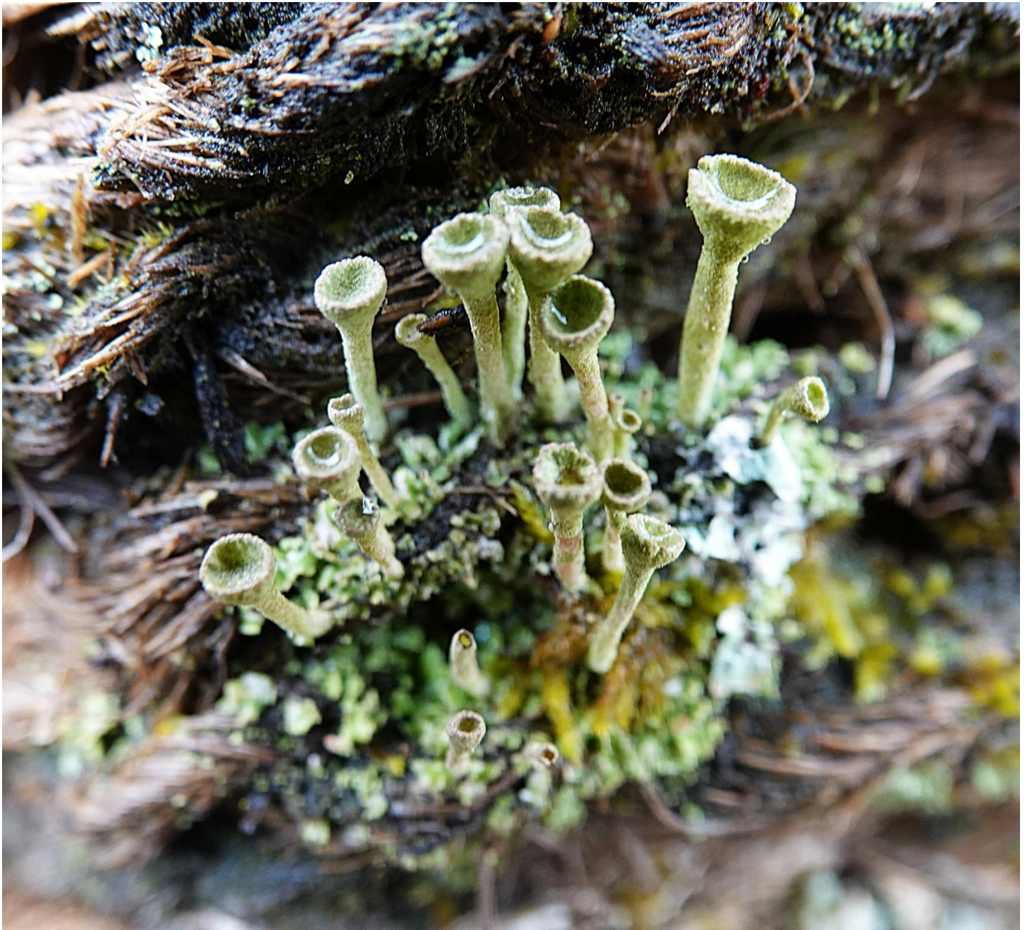
Cladonia fimbriata (L.) Fr., 1831 - Lecanorales - Cladoniaceae

« sur décoration 'panier' avec tiges métalliques et cordelettes en chanvre)