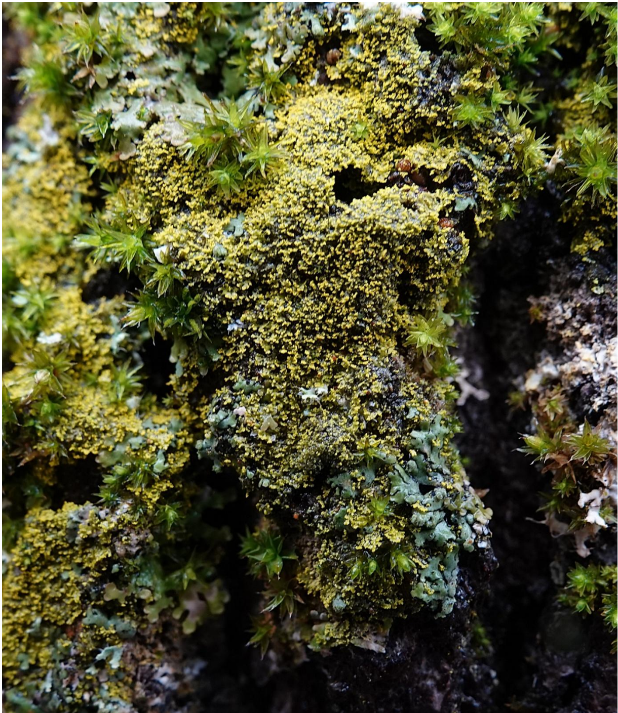
Candelaria concolor (Dicks.) Arnold, 1879 - Candelariales - Candelariaceae