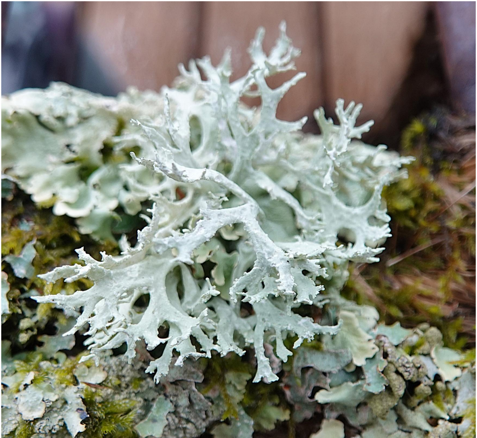
Evernia prunastri (L.) Ach., 1810 - Lecanorales - Parmeliaceae

« sur décoration ‘panier’ avec tiges métalliques et cordelettes en chanvre »