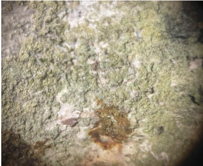
Réaction K+ jaune puis brunâtre