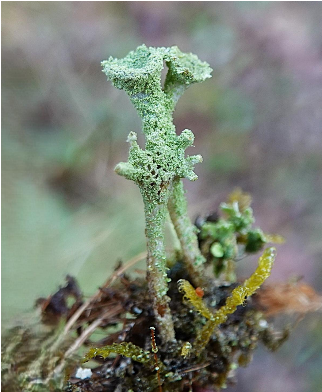
Cladonia ramulosa (With.) J.R. Laundon, 1984 Lecanorales - Cladoniaceae

« sur décoration 'panier' avec tiges métalliques et cordelettes en chanvre »